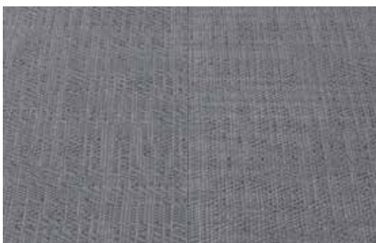
Vinyle tissu (de 22.2 x 66.7 à 50 x 50 cm)