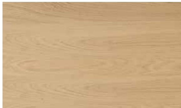
Parquet en lames longues (150 – 200 x 18 cm)