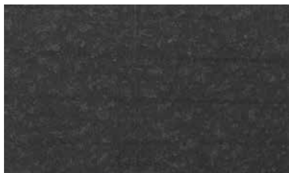
Pierre naturelle (de 30 x 60 cm à 60 x 120 cm)