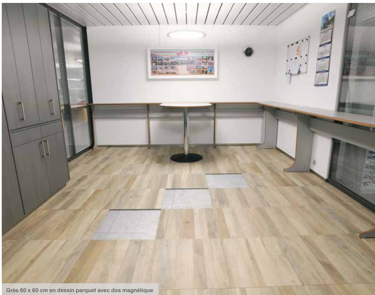
Grès 60 x 60 cm en dessin parquet avec dos magnétique

La pose sans colle s'effectue sans temps d'attente, elle est propre et ne laisse aucune trace sur le faux-plancher.