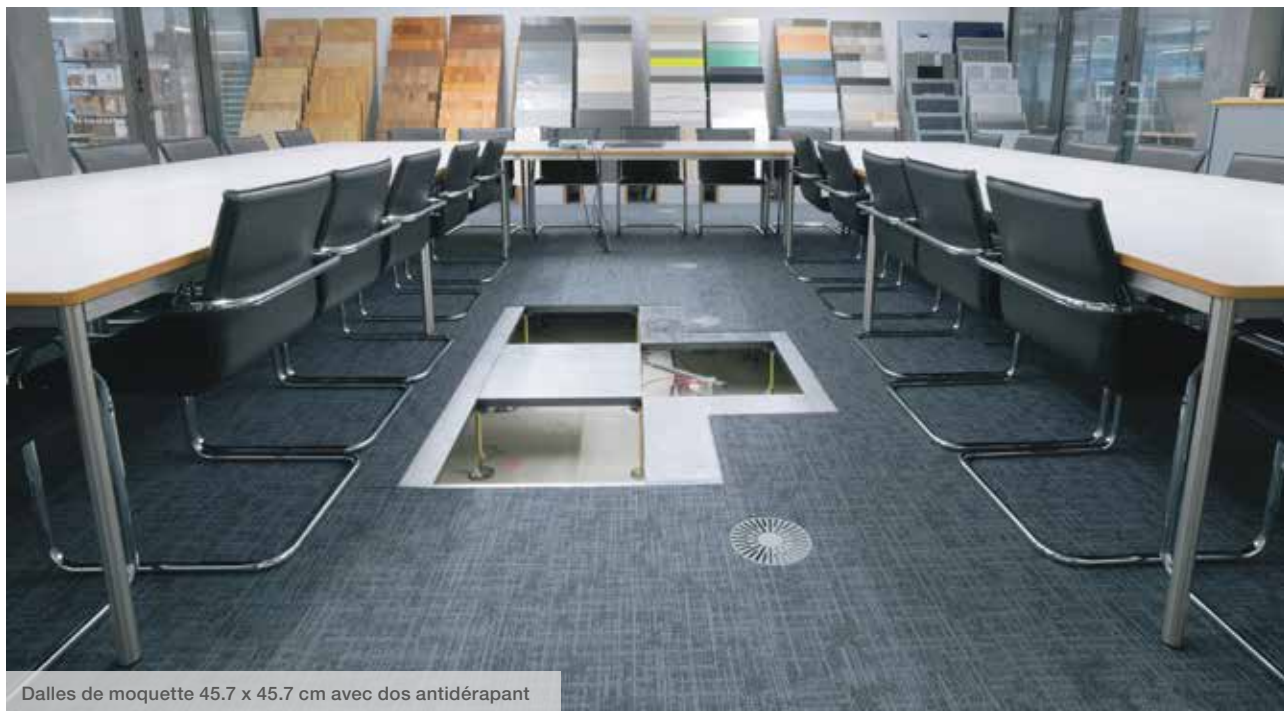
Dalles de moquette 45.7 x 45.7 cm avec dos antidérapant

Grace à ces avantages, en cas de revêtements textiles ou élastiques, depuis longtemps les revêtements à pose libre sont du standard dans les bureaux et les bâtiments administratifs. Depuis longtemps, on a cherché des solutions avec des revêtements en parquet, céramique et pierre naturelle – sans succès jusqu'à présent. C'est la raison du grand intérêt pour la nouvelle gamme complète de AGB.