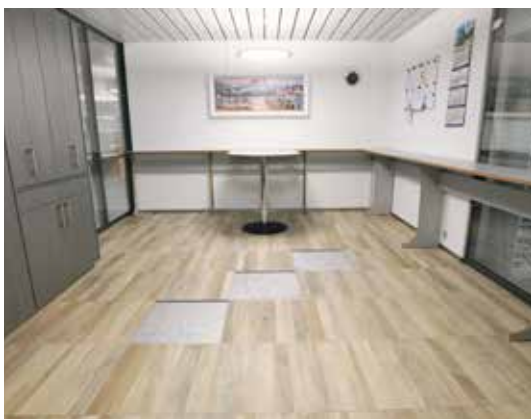
Céramique, dessin parquet