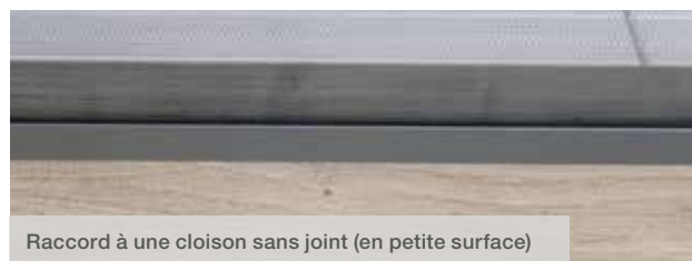
Raccord à une cloison sans joint (en petite surface)