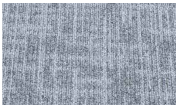
Moquette (de 45.7 x 45.7 à 60 x 60 cm)

La gamme la plus large en Suisse | vous trouverez beaucoup d'autres formats et dessins dans notre assortiment.