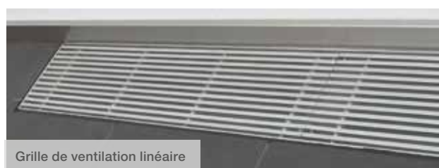
Grille de ventilation linéaire

La professionnalité d'un fournisseur ne se manifeste pas seulement par la pose rapide et un revêtement proprement posé sans claquement, mais aussi par les détails des raccords à des éléments complémentaires (boîtes, grilles etc.) ou contre les façades.