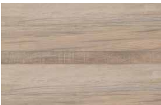
Céramique en dessin parquet (de 30 x 60 cm à 60 x 60 cm)