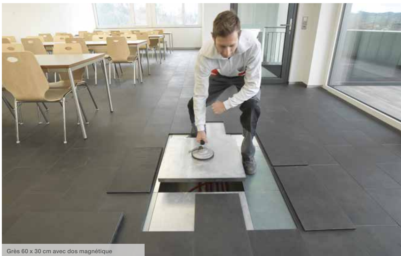
Grès 60 x 30 cm avec dos magnétique