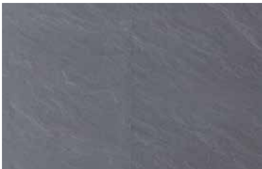
Vinyle (de 20 x 100 cm à 50 x 50 cm)