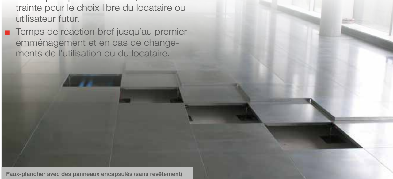
Faux-plancher avec des panneaux encapsulés (sans revêtement)