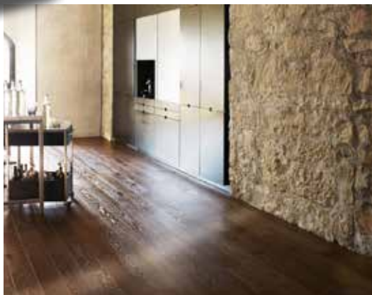
Parquet, lames longues